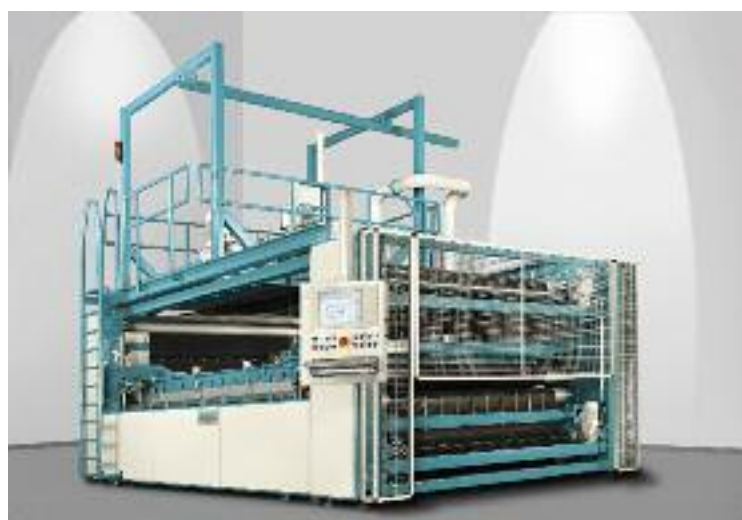
Das Vakuum-Laminiersystem Icolam bietet optimalen Schutz von Photovoltaikerelementen vor Umwelteinflüssen

rungeinflüssen schützen. Ohne diese Laminatoren, bei denen die MEIER SOLAR SOLUTIONS GMBH von einer Lebensdauer von 20 Jahren ausgeht, wäre der störungsfreie Betrieb von Solaranlagen gar nicht möglich. Entsprechend durchschlagend ist der Erfolg des Unternehmens bei den Herstellern von Solaranlagen. Die Crème de la Crème der Branche nutzt die unverzichtbaren Laminatoren aus Bocholt: Von Oerlikon über Schott Solar und Kyocera lassen die Großen der Sonnenindustrie bei der MEIER SOLAR SOLUTIONS GMBH produzieren. Inzwischen hat das Unternehmen sich auch eine international be-