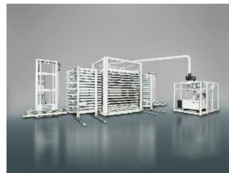
Der 2008 eingeführte Etagenlaminator Stacolam ist die größte Anlage ihrer Art weltweit. Stacolam kann vier bis fünf herkömmliche Laminatoren ersetzen

hinaus vor allem eines den Geschäftserfolg seines Unternehmens ausmacht: nämlich das beständige Bemühen, Solar Solutions die Technologieführerschaft zu sichern. So ist das Unternehmen beispielsweise Mitglied im Verein Solar Valley Sachsen-Anhalt e.V., in dem in Halle an der Saale Forschungsinstitute, Universitäten und Unternehmen zusammengeschlossen sind, um die Solartechnologie weiter voran zu bringen. Für die MEIER SOLAR SOLUTIONS GMBH jedenfalls hat sich das frühe und in- >