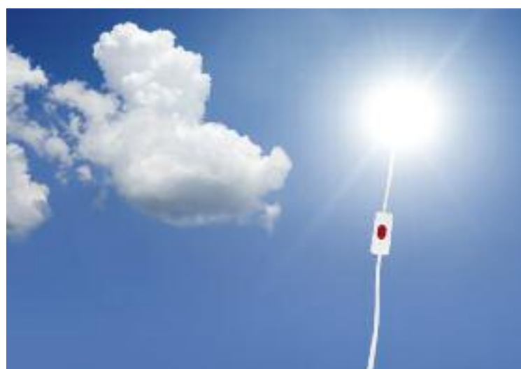
Die zündende Idee: Energie aus der Kraft der Sonne